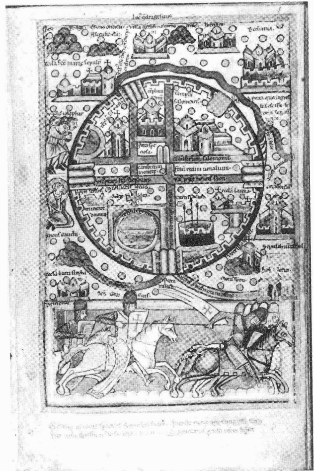
Kaart van Jeruzalem. Psalter, ca 1180. KB Den Haag, Hs 76 F 5. Te zien in KEULEN.

NEW YORK , Pierpont Morgan Library, 26 februari - 26 mei 1985: Austrian Mediaeval Manuscripts. 29 mei - 31 juli 1985: Mediaeval Secular Manuscripts.