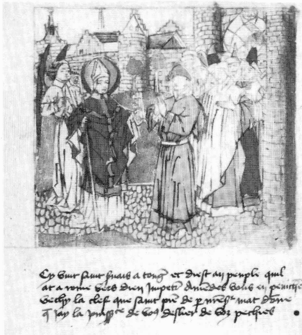
Servaes komt aan te Tongeren. 'Het blokboek van Sint Servaes', ca 1460. KB Brussel, Prentenkabinet hs. 18. 972.

De vereniging Vrienden van de Leuvense Universiteitsbibliotheek maakte een introductie-nummer van haar bulletin "Ex officina". Vanaf 1985 zal het blad drie maal per jaar verschijnen. Adres: Universiteitsbibliotheek, Mgr. Ladeuzeplein 21, 3000 Leuven.